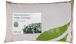
Muruseeme Sport Turfline DLF

38.80 7,5 kg HIND KLIENDIKAARDIGA 5.17/kg