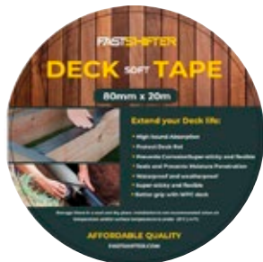
Puitkonstruktsiooni kaitseteip BUTYL DECK

18.50 24.90 80 mm x 20 m HIND KLIENDIKAARDIGA